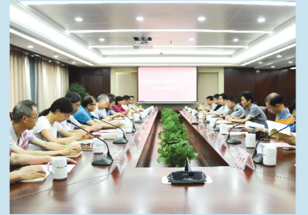
▲ 佛山市顺德区人大常委会来我区考察交流