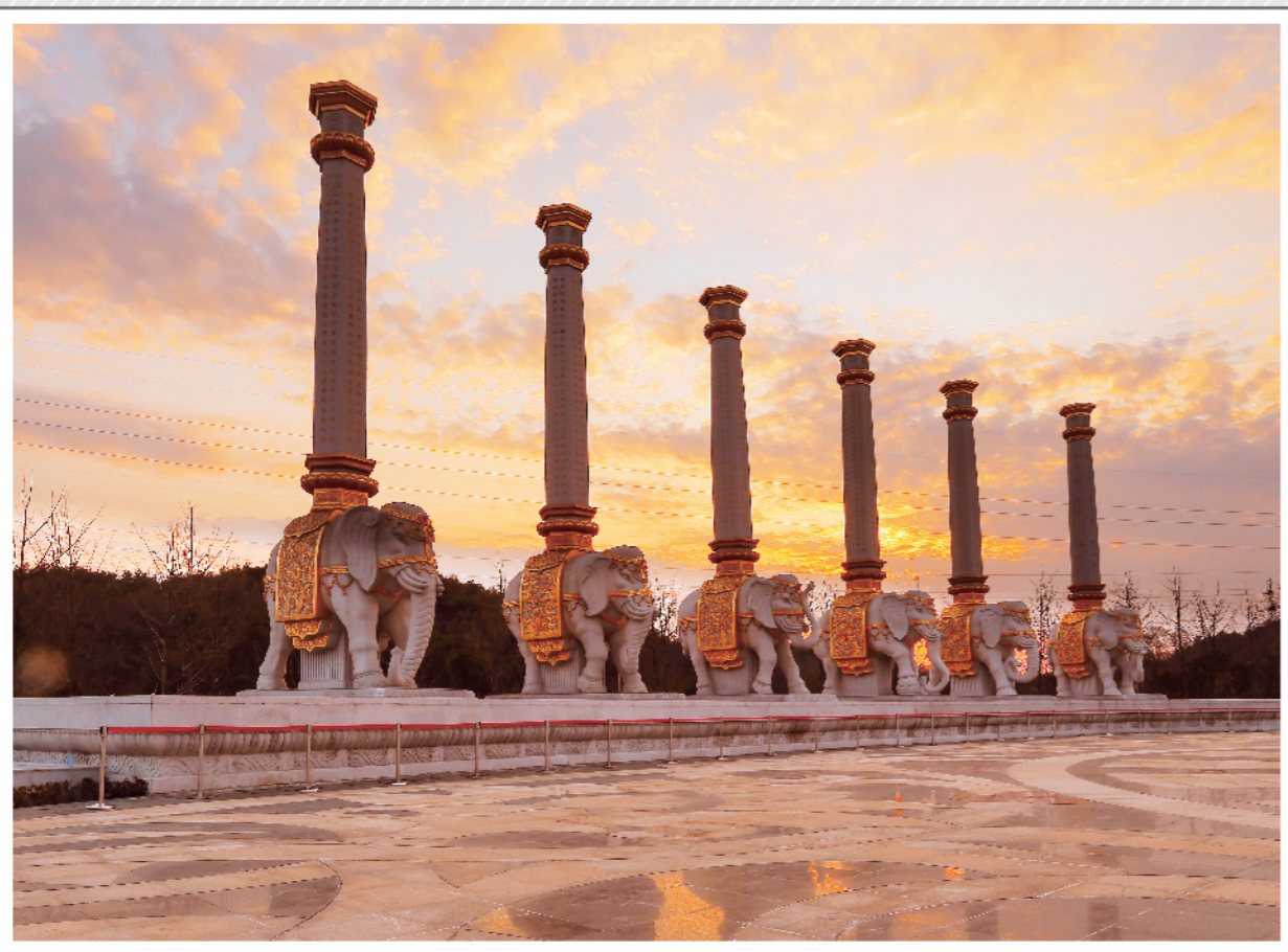
晚霞中的圣象广场