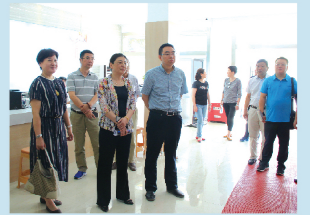
▲ 上海市杨浦区人大常委会来我区考察交流