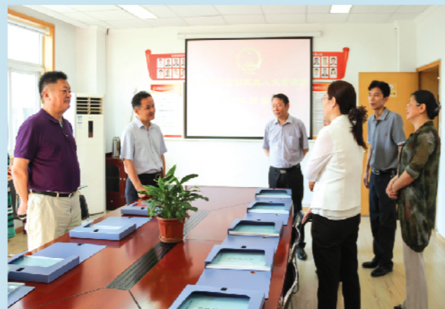
▲ 厦门市湖里区人大常委会来我区考察交流