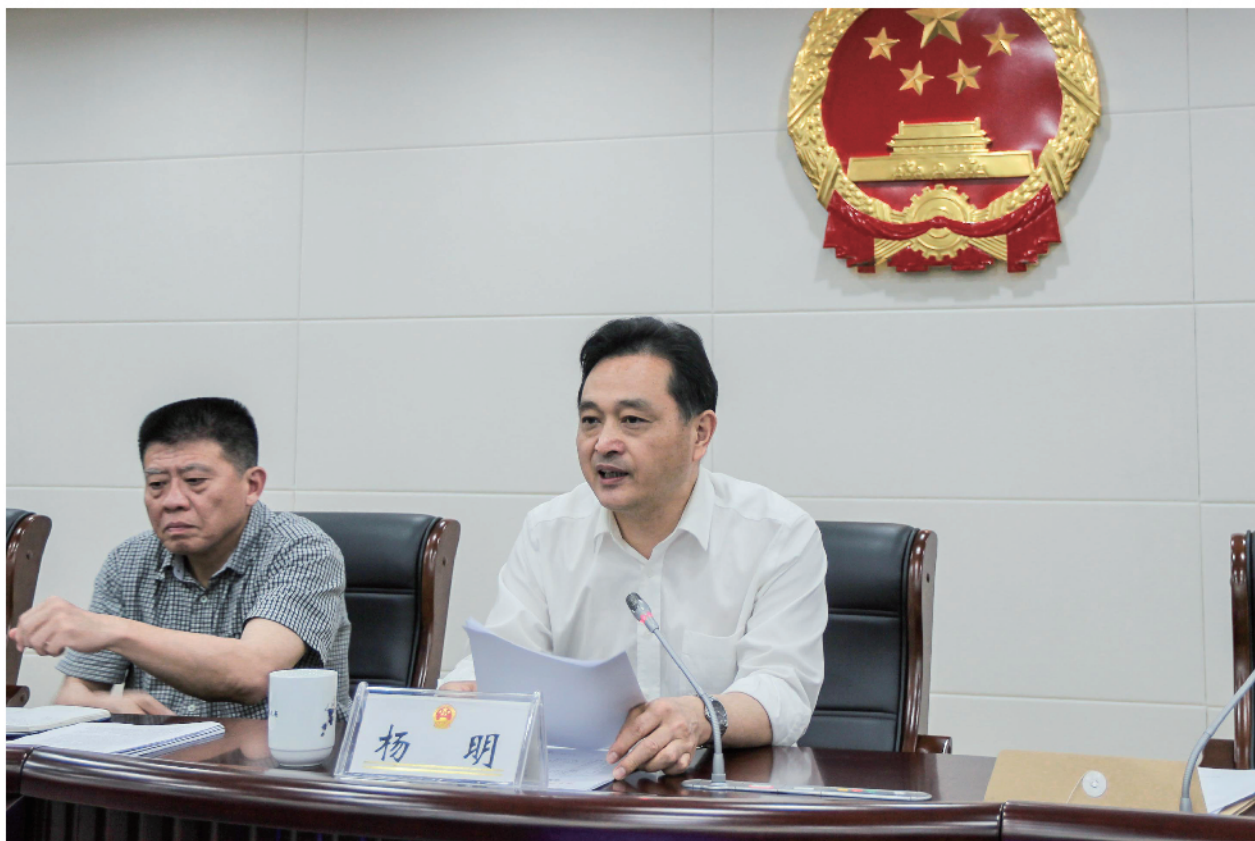
▲5月28日下午，区第十八届人大常委会第十次会议在区级机关九楼会议室举行